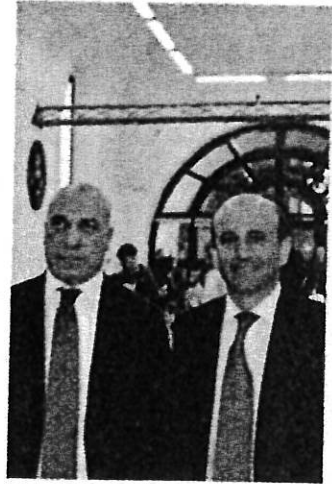
Cantarella e Sella

mente prime nella classifica generale e nella classifica della sostenibilità (Concorso scolastico). Come premio per la prima squadra vincitrice (nella classifica generale) “Training Stars” la partecipazione al Meeting Nazionale di Conoscere la Borsa che si svolgerà a Volterra dal 9 all'11 aprile, insieme agli studenti coinvolti in Italia da altre 7 Fondazioni e da 1 Cassa di Risparmio. La Fondazione Carisal offrirà agli studenti e ai docenti il viaggio di andata e ritorno. A tutti gli studenti e i docenti che hanno preso parte a “Conoscere la Borsa” è stato consegnato attestato e premio di partecipazione.